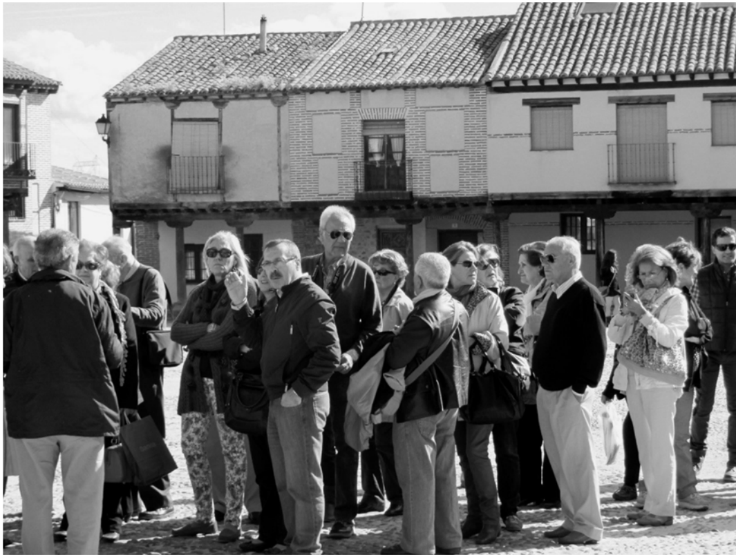
(2013 – Arévalo. Las Edades del Hombre)