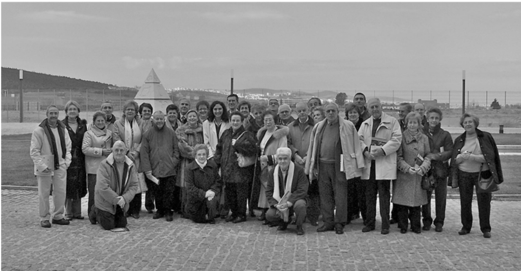
(3 - Visita al Centro de los miembros de la UMEX-CÁCERES en 2007)

asociación que diera a conocer por todo el mundo la existencia del CCMI, porque no disponían de recursos para este fin. Vimos la posibilidad de asociarnos con esa doble finalidad: realizar actividades culturales para los socios y difundir el Centro en todos los ámbitos. La Institución aportaría, al principio, los recursos materiales (una sede, las fotocopias para comunicaciones a los socios, etc.) y la Universidad de los Mayores, los recursos humanos, las personas. No podían ser mejores, puesto que ellas mismas se habían seleccionado al mostrar su interés por la Ciencia en todas las ramas del saber. Lo que se necesita en una Asociación son personas que tengan inquietudes y que colaboren, en la medida de sus posibilidades, para que lleve una vida provechosa para sus socios y para la sociedad en general.