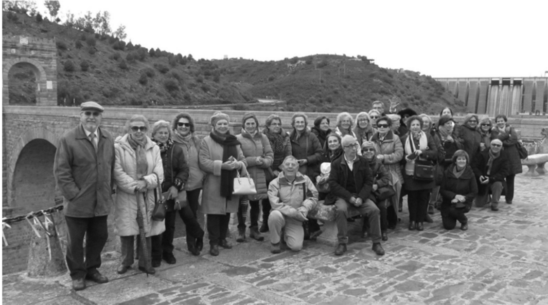
(31 - Grupo de socios en Alcántara – 16 de marzo)

Hicimos un viaje a La Vera, con 72 socios, para ver, en Valverde, el “Museo del Empalao” y, en Villanueva, la celebración del Peropalo. Interesante (13/02). Asistí a un curso para directivos de CEATE, a la que estamos asociados, en Santiago de Compostela (23/02). Con 30 socios, viajamos a Arroyo de la Luz, Brozas y Alcántara, con guía. Comenzó lloviendo pero luego fue un magnífico día, comiendo en la antigua Fábrica de Harina (17/03). El “Día del Socio” (09/06) lo celebramos en Coria y Eljas. Desayuno y comida en el Hotel Palacio (****). Mercado Medieval en Eljas, visita a Coria con guía y “Fiesta de los Acordeones” en la Casa de Cultura. Lo pasamos bien y comimos ¡de cine!