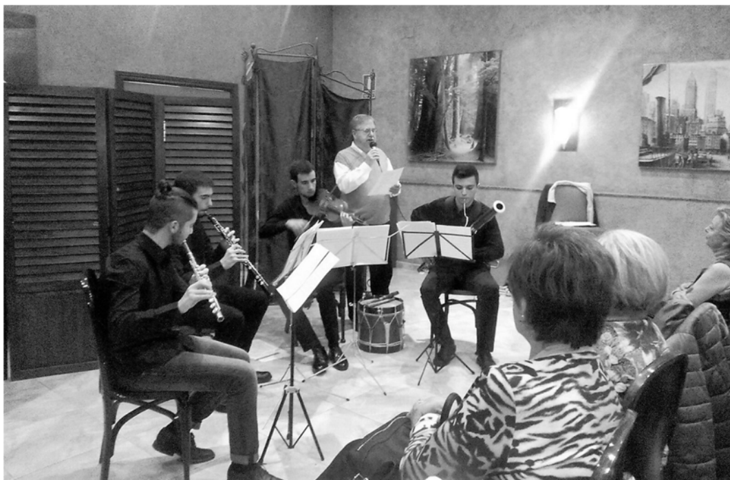
(23 - Concierto de Año Nuevo en el Hotel Alfonso IX – 9 de enero)

Comenzamos el año con el ya habitual “Concierto de Año Nuevo”, precedido de un desayuno para los 84 socios asistentes, celebrado en el Hotel Alfonso IX. Estuvo a cargo de los jóvenes del cuarteto “Cavallieri” y fue muy aplaudido.