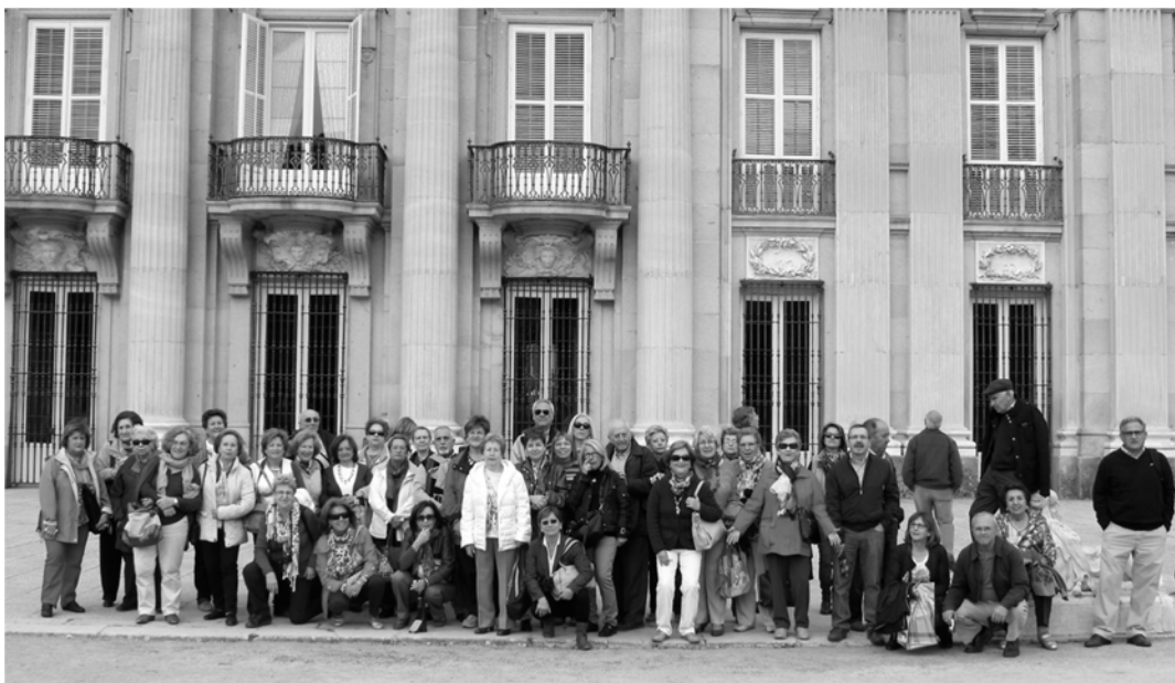
(2013- La Granja)