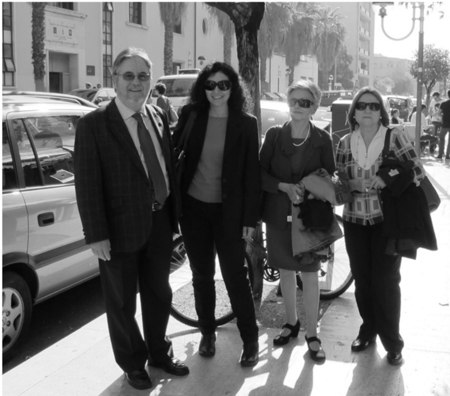
(15 - Difusión en la Università de la Sapienza. Facoltà di Medicina de Roma, en Latina. Italia)