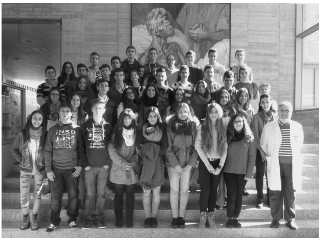
(17 - Visita guiada con alumnos del Colegio Claret, de Don Benito el 5/11)

Los visitantes a los que guiamos por el CCMIJU fueron muy numerosos: En total, 1.012 personas. Algunos, franceses de Blois. Nos reunimos periódicamente para revisar la forma de realizar las visitas, cambiar los videos y los recorridos por el Centro.