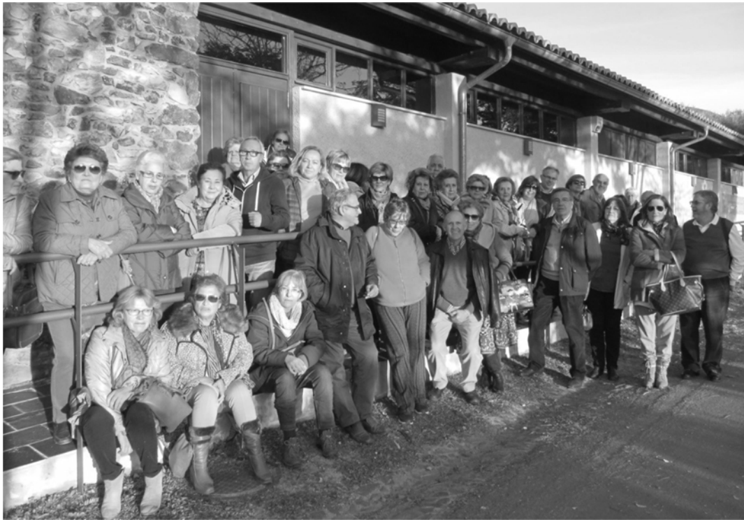
(27 - Grupo de socios en el C.I. de la Cueva de Castañar de Ibor el 12/11)