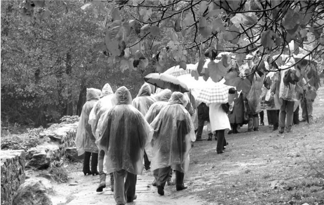
(10 - Bajo la lluvia, camino del Museo Pérez Comendador. Hervás)

Viajamos a Hervás, en un día muy lluvioso (19/11) y tuvimos que usar los impermeables de pitufos (de color azul) camino del Museo.