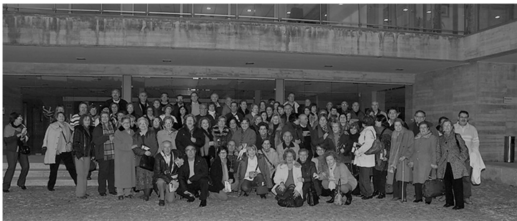
(7 - Foto de la visita al CCMIJU de la Universidad de los Mayores)

Comenzamos el año visitando Institutos para hablarles del CCMIJU (Oliva de la Frontera, Villafranca de los Barros, Ceclavín, las Josefinas de Cáceres, el Sagrado Corazón de Cáceres y de Miajadas, “El Brocense” de Cáceres); también lo presentamos en el CIMOV nº 1, en la Casa de Cultura de Palomero, y en la UMEX de Cáceres, a los cursos 1º y 2º. Ampliamos nuestro radio de acción para acudir a las Casas de Extremadura de Alcorcón, Móstoles, Getafe, Sevilla y Alcalá de Guadaíra, (que se sintieron orgullosos de tener un Centro así en nuestra Comunidad Autónoma) con lo cual llegamos con la difusión a unas 700 personas.