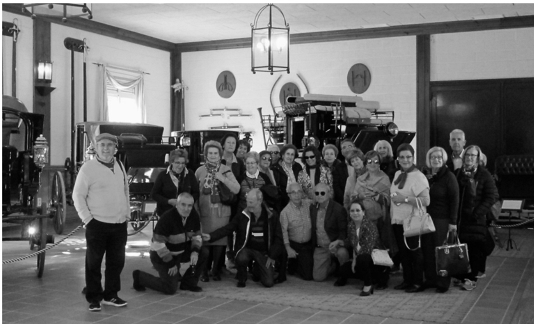
(2018 –En la Yeguada La Cartuja de Jerez de la Frontera)