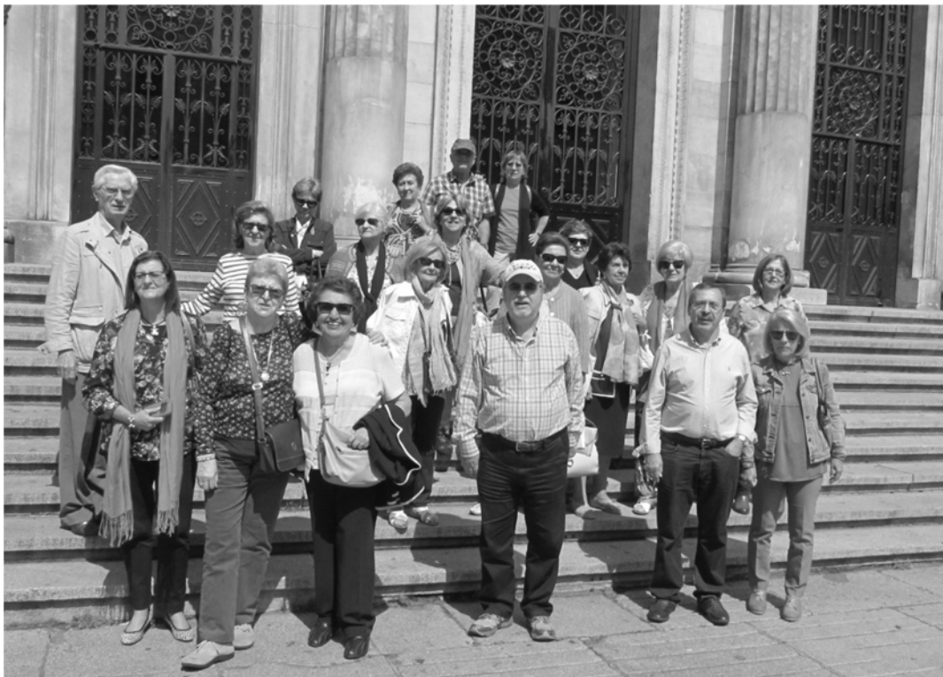
(26 - Visita al Museo Arqueológico Nacional en Madrid – 4 de mayo)