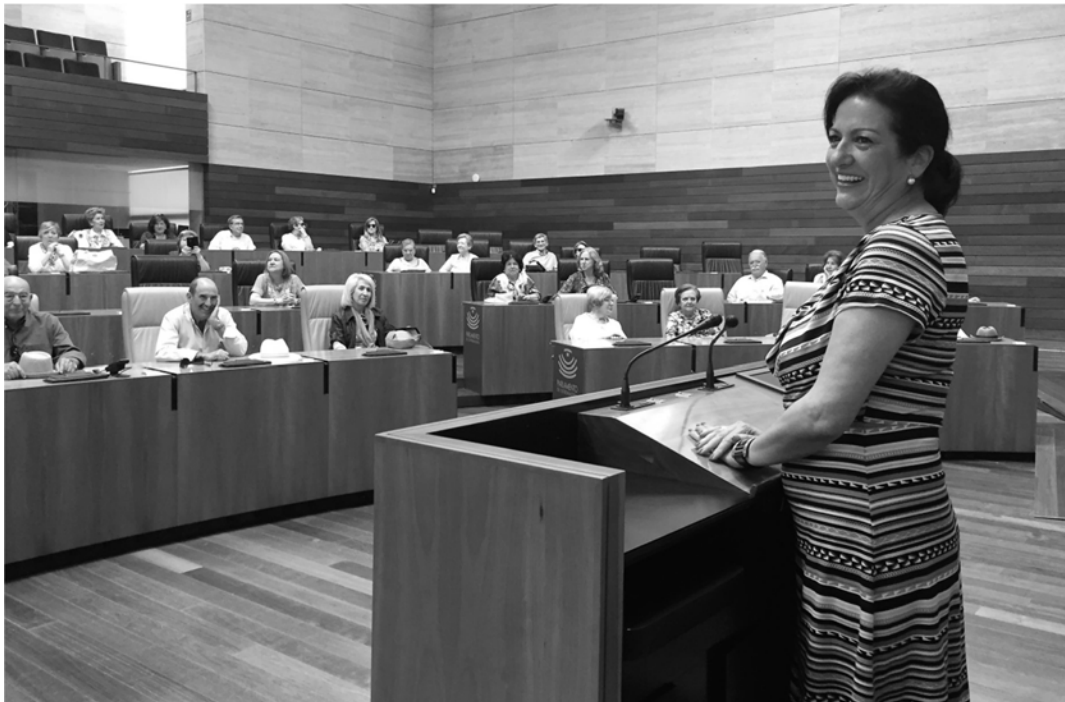
(22 – La Sra. Vicepresidenta, recibió a los socios de ASCEMI)

El 12/05, 77 socios de ASCEMI visitamos la Asamblea de Extremadura, invitados por la Sra. Vicepresidenta (foto de grupo en la portada posterior), comimos en un salón del Hotel Mérida Palace, donde, con un coro de preguntones, interpreté una pieza teatral de mi autoría (sobre la vida de Augusto) como prólogo a la visita al Museo Romano.