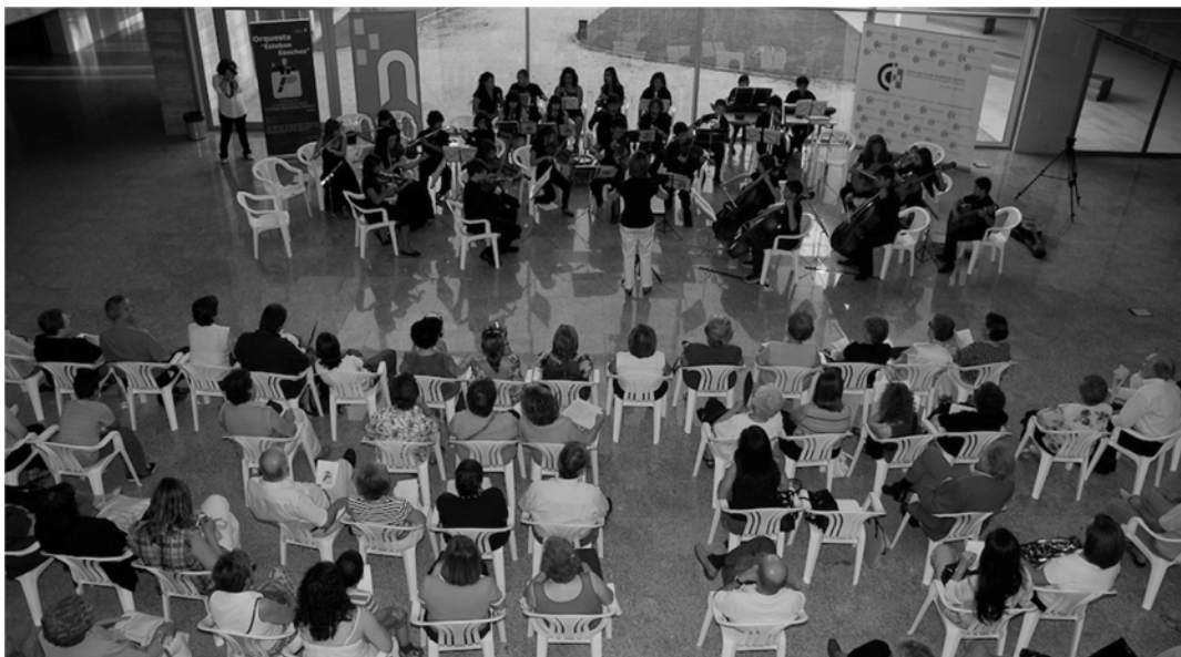
(6 - Concierto Orquesta “Esteban Sánchez” del IES Prof. Hdez. Pacheco)