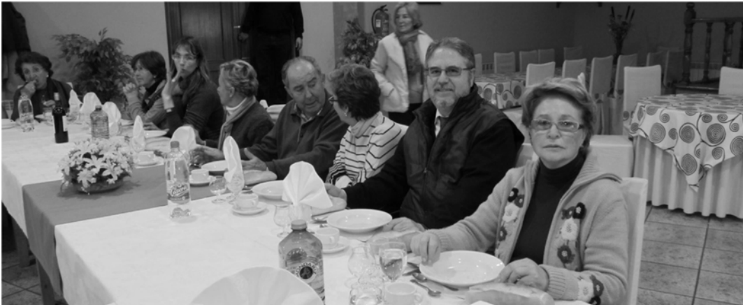
(8 – Comida En el cruce de Moheda, viaje a Cáparra)